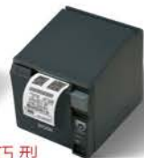
輕巧型 TM-T70II 熱感式電子發票收據印表機