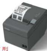
超值型 TM-T82II 熱感式電子發票收據印表機