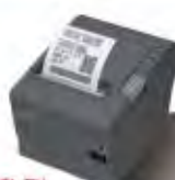
旗艦型 TM-T88V 超高速熱感式收據印表機 省電節能33%