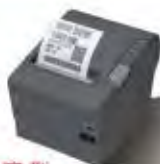
經濟型 TM-T82II 熱感式電子發票收據印表機