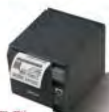
實用型 TM-T70II 熱感式電子發票收據印表機