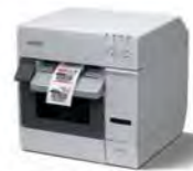
TM-C3400 噴墨式彩色標籤機