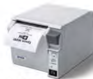
TM-T70 熱感式電子發票收據印表機

整合電子發票、折價卷、貨品標籤等列印功能，優異的穩定性與高耐用度，創造更高的營運績效。