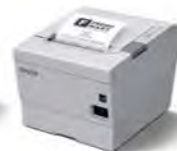
TM-T88V 超高速熱感式收據印表機 壽命延長 3.3%