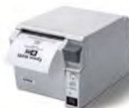
TM-T70 熱感式電子發票收據印表機

整合電子發票、折價卷、貨品標籤等列印功能，優異的穩定性與高耐用度，創造更高的營運績效。