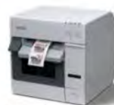
TM-C3400 噴墨式彩色標籤機