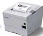
TM-T88V 超高速熱感式收據印表機 壽命延長 3.3%