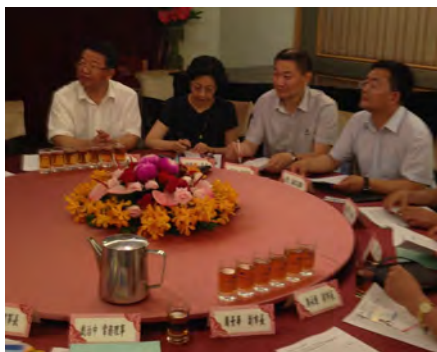
2013 兩岸農產加工食品業交流洽談會