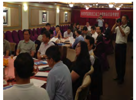
2013 兩岸農產加工食品業交流洽談會