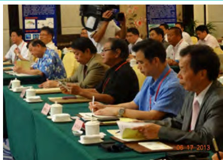
台灣參加論壇活動人員

福建省連城縣於6月16至18日舉辦『第五屆海峽論壇』暨『第三屆海峽客家風情節』一系列活動，圍繞“展示兩岸客家民俗風情，以文會友，促進交流合作，實現互利雙贏”活動主題，兩岸嘉賓通過“非遺”傳承與保護研討會、文化創意產品展、光電產業投資貿易說明會、海峽兩岸導遊風采大賽、書畫攝影展等活動，進行經貿、旅遊、文化等方面的交流與合作。本會受邀由兩岸事務委員會主任委員林國棟先生率10家會員企業前往參與，期藉由文化媒介促進互動交流。