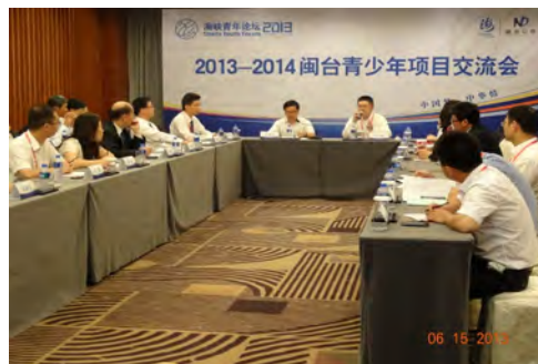
台青少年項目交流會

海峽青年論壇組委會於6月14日至16日假福建省廈門市舉辦第十屆『海峽青年論壇』，本屆論壇是以『中國夢·中華情』為主題，舉辦一系列之活動。主體活動由開幕式暨主旨論壇、閩台青少年項目交流會、兩岸青年創業家園論壇等3項組成。