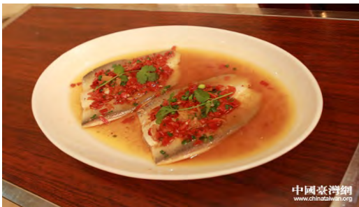
研討會的兩場招待晚宴上，臺灣虱目魚將作為接待用菜首次亮相。

大陸自 2011 年起連續兩年內，國臺辦的協調下，由上海水產集團向臺灣臺南市學甲區推動虱目魚契作採購，參與契作的漁戶主要是當地因病而貧、孤寡而貧、因災而貧的弱勢家庭。在契作採購執行兩年多來，除增加契作漁民收入外，更擴大了虱目魚市場銷路，廣受當地漁民的歡迎。