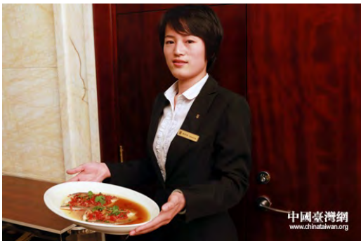
研討會的兩場招待晚宴上，臺灣虱目魚將作為接待用菜首次亮相。

由於大陸消費者初期對虱目魚的名稱較陌生，為能大力提昇虱目魚的知名度，上海水產集團與台灣禎祥食品公司於 2012 年 3 月 8 日，在蘇州禎祥廠共同舉辦「虱目魚美食發表會」宣導推廣活動，發表適應大陸不同地區口味的全魚料理、魚肚料理包及魚丸、魚松等加工的十多種產品，除提昇虱目魚全魚的經濟效益外，另進一步提高了虱目魚的產品附加價值。